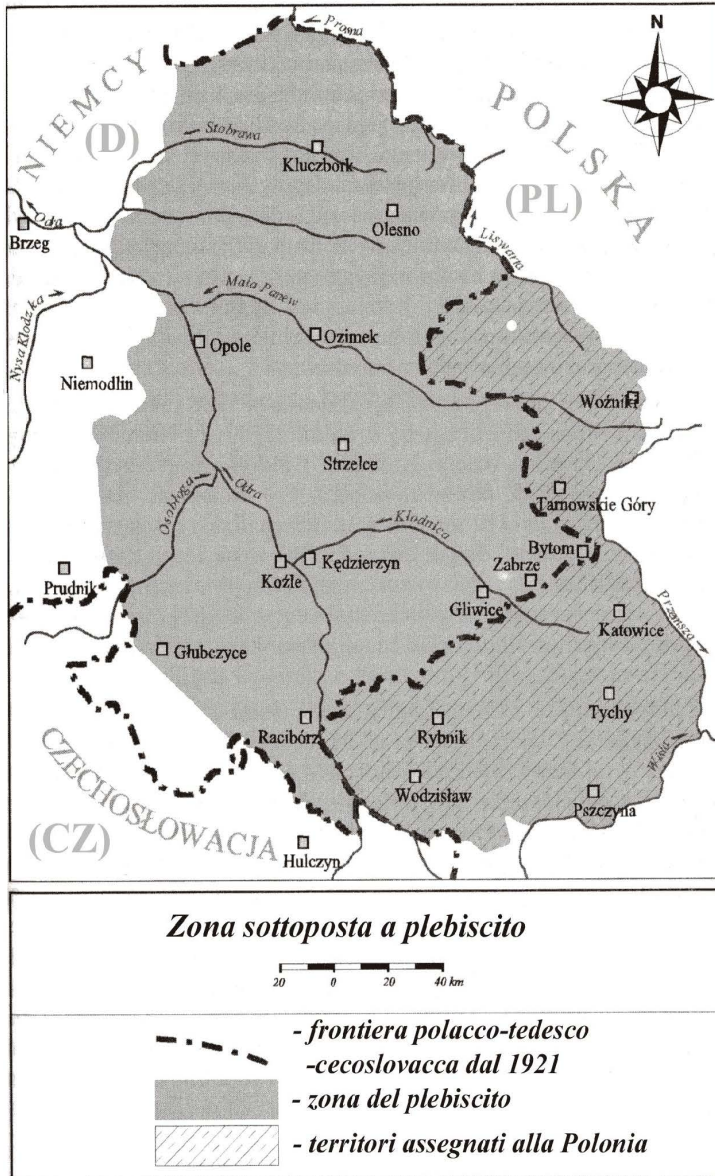
R. PYSIEWICZ-JĘDRUSIK, A. PUSTELNIK, B. KONOPSKA, Granice Śląska , Wyd. Rzeka, Wrocław, 1998.